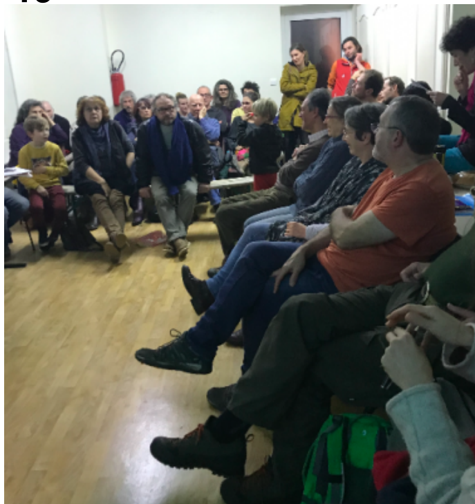
Assemblée Générale du 19/12/19 aux Salces