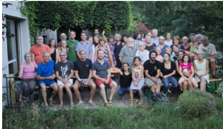
AG Ma COOP du 12 Juillet 2019 à la future Auberge coopérative des 3 Rivières